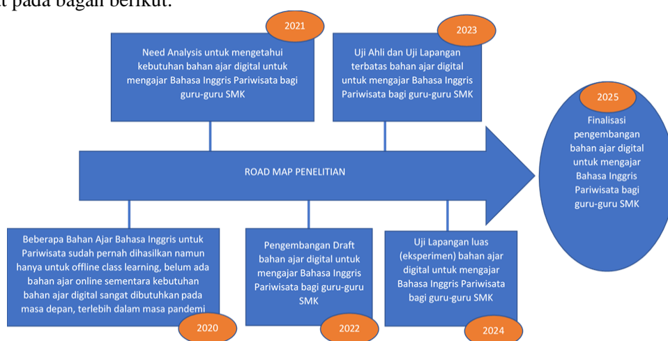
Gambar 1. Roadmap penelitian dari tahun 2021 sampai dengan tahun 2025

Penelitian need analysis ini adalah awal dari proses panjang pengembangan bahan ajar digital Bahasa Inggris untuk Pariwisata. Nantinya bahan ajar digital ini akan didesain sedemikian rupa hingga bisa digunakan untuk pembelajaran daring maupun luring. Diharapkan masalah proses pembelajaran seperti yang dialami saat pandemi Covid-19 dapat diatasi di masa depan. Roadmap penelitian ini dapat dilihat pada bagan berikut: