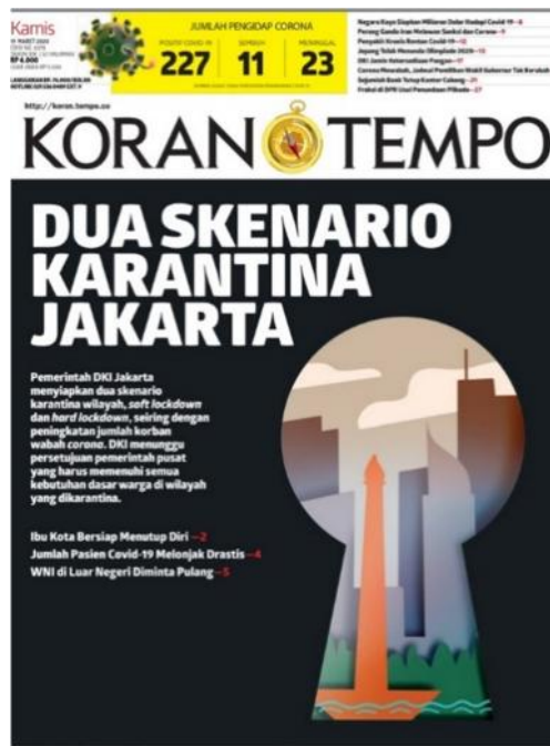
Gambar 2. Istilah ‘Karantina’ Digunakan dalam Judul Halaman Depan Koran Tempo