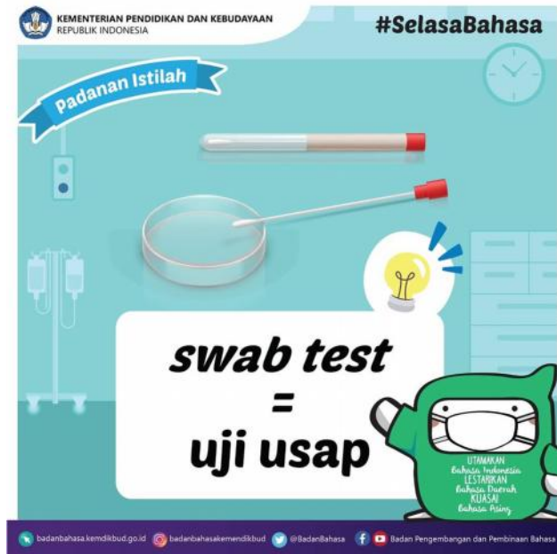
Gambar 20. Istilah ‘Tes Usap’ Digunakan dalam Postingan Twitter

Yaitu salah satu cara pengujian untuk mendeteksi seseorang terjangkit Virus Corona atau tidak dengan cara mengusapkan alat di sekitar tenggorokan seseorang untuk diambil sampel lendirnya. Istilah tersebut pernah digunakan dalam postingan akun Twitter @BadanBahasa pada 7 April 2020 guna menjelaskan arti dari istilah tersebut.