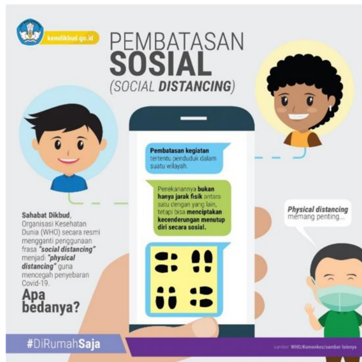
Gambar 14. Istilah ‘Pembatasan Sosial’ Digunakan dalam Postingan Twitter

Yaitu istilah yang digunakan untuk situasi di mana masyarakat diharuskan untuk menjaga jarak dari orang lain dan menghindari keramaian guna mencegah penularan penyakit. Istilah tersebut pernah digunakan dalam postingan akun Twitter @Kemdikbud_RI pada 31 Maret 2020 guna menjelaskan arti dari istilah tersebut.