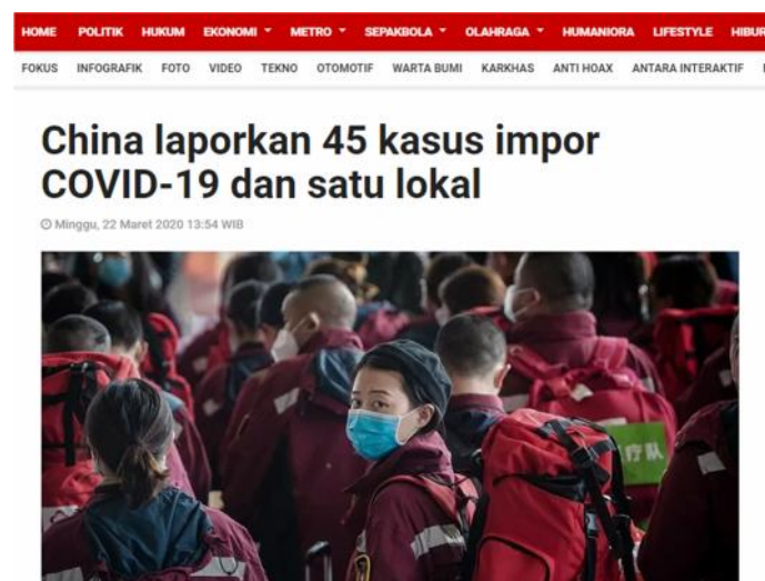
Gambar 11. Istilah ‘kasus impor’ dan ‘penularan lokal’ digunakan dalam Judul Berita.

‘Kasus impor’ adalah istilah yang digunakan untuk kejadian pasien tejangkit Virus Corona yang infeksinya diperoleh dari luar negeri. Sedangkan ‘penularan lokal’ yaitu istilah yang digunakan untuk kejadian pasien tejangkit Virus Corona yang infeksinya diperoleh di tengah lingkungan masyarakat itu sendiri. Kedua istilah tersebut pernah digunakan dalam judul sebuah artikel terbitan Antara News pada 22 Maret 2020 (antaranews.com, 2020).