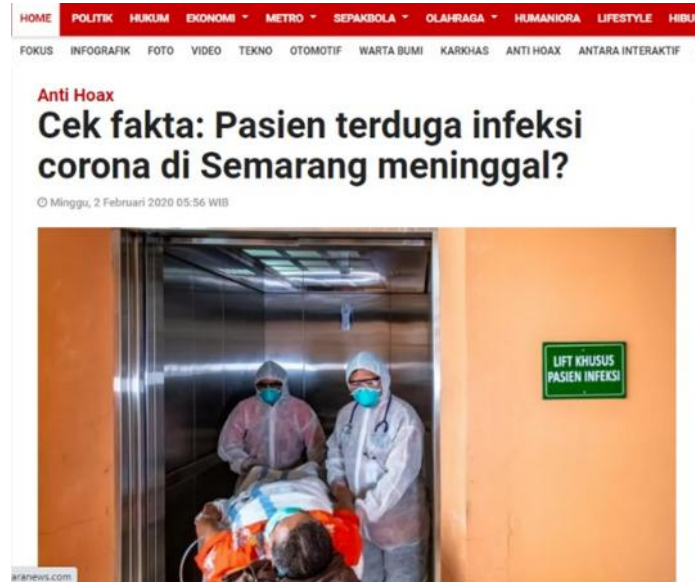
Gambar 10. Istilah ‘terduga’ Digunakan dalam Judul Berita.

Yaitu istilah yang digunakan untuk orang diduga terjangkit Virus Corona dan memiliki kontak erat dengan orang atau lingkungan yang terinfeksi penularan Virus Corona. Istilah tersebut pernah digunakan dalam judul sebuah berita pada 2 Februari 2020 yang diterbitkan oleh Antara News (antaranews.com, 2020).