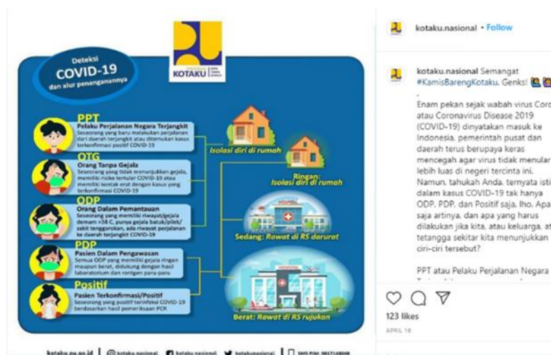
Gambar 7. Istilah ‘Pasien Dalam Pengawasan (PDP)’ digunakan dalam Postingan Instagram

Yaitu istilah yang digunakan untuk orang yang memiliki gejala demam dan gangguan saluran pernapasan, serta diindikasi pernah berkontak langsung dengan orang atau lingkungan yang terinfeksi penularan Virus Corona. Istilah tersebut pernah digunakan dalam postingan akun Instagram @kotaku.nasional pada 16 April 2020 guna menjelaskan arti dari istilah tersebut.