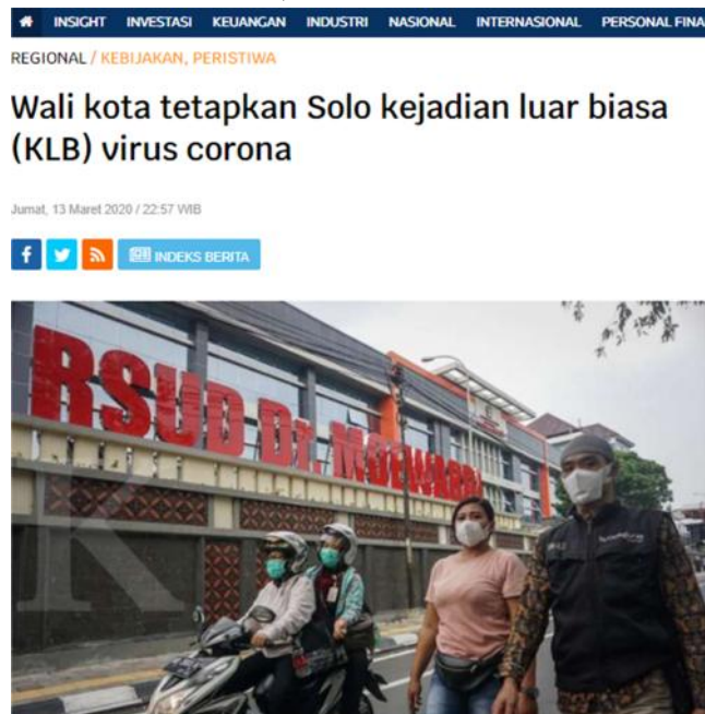
Gambar 13. Istilah ‘Kejadian Luar Biasa’ Digunakan dalam Judul Berita

Yaitu istilah yang digunakan atas timbulnya atau meningkatnya kejadian kesakitan dan atau kematian yang bermakna secara epidemiologis pada suatu daerah dalam kurun waktu tertentu. Istilah tersebut pernah digunakan dalam judul sebuah berita terbitan Kontan pada 13 Maret 2020 (Regional.kontan.co.id, 2020).