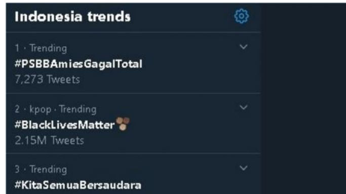
Gambar 12. Istilah ‘Pembatasan Sosial Berskala Besar (PSBB) Menjadi Topik Teratas di Twitter.

Yaitu istilah yang digunakan untuk kebijakan pemerintah dalam memutus rantai penyebaran dengan cara memberikan pembatasan bagi semua sektor lapisan masyarakat yang memiliki potensi penyebaran Virus Corona. Istilah tersebut pernah menjadi topik teratas di Twitter dengan tagar #PSBBAmiesGagalTotal pada tanggal 4 Juni 2020. Tercatat ada lebih dari 6,3 ribu cuitan yang menggunakan tagar tersebut pada 13:40 WIB pada hari itu.