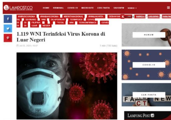
Gambar 6. Istilah ‘Virus Korona’ Digunakan dalam Judul Artikel.