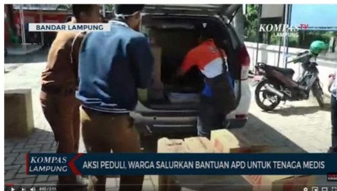
Gambar 3. Istilah ‘Alat Pelindung Diri (APD) Digunakan Menjadi Judul Berita.

Alat Pelindung Diri (APD) atau Personal Protective Equipment (PPE) . Secara singkat, APD merupakan pakaian ataupun peralatan yang dirancang khusus untuk melindungi tubuh seseorang dari cedera. Pada dasarnya APD bertujuan dalam upaya Keselamatan dan Kesehatan Kerja (K3), sesuai dalam Undang-undang Keselamatan dan Kesehatan Kerja (K3) tahun 1970. Sehingga, APD dapat digunakan oleh semua kalangan ketika melakukan pekerjaannya dalam rangka mengurangi atau mencegah risiko, termasuk di bidang medis. Pada abad ke-16, para dokter di Eropa juga sudah mengenakan seragam pelindung diri ketika menangani korban wabah pada saat itu (McGowan dan Stumph, 2015). Namun, dalam beberapa tahun terakhir, dalam tulisan Lynteris (2018) menyatakan bahwa peralatan APD diyakini dipromosikan oleh Wu Lien-the pada tahun 1910—1911 ketika terjadi wabah Pneumatik Manchuria. Istilah ‘Alat Pelindung Diri (APD)’ sempat menjadi judul suatu berita dalam akun Youtube KOMPASTV pada 7 April 2020 (KOMPASTV, 2020).