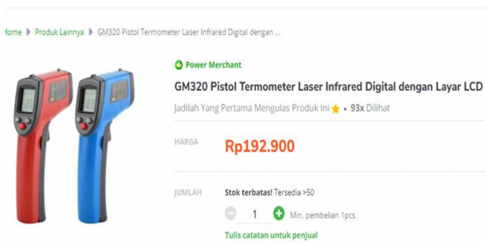
Gambar 17. Istilah ‘Pistol Termometer’ Digunakan dalam Iklan Penjualan

Yaitu istilah yang digunakan untuk menyebut alat bantu mengukur suhu tubuh seseorang tanpa menyentuh orang tersebut. Istilah tersebut pernah digunakan dalam situs penjualan Toko Pedia (Tokopedia.com, 2020).