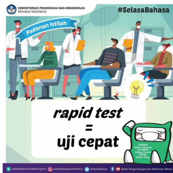
Gambar 19. Istilah ‘Tes Cepat’ Digunakan dalam Postingan Twitter

Yaitu salah satu cara pengujian untuk mendeteksi seseorang terjangkit Virus Corona atau tidak secara cepat. Istilah tersebut pernah digunakan dalam postingan akun Twitter @BadanBahasa pada 7 April 2020 guna menjelaskan arti dari istilah tersebut.