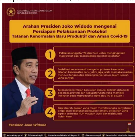
Gambar 18. Istilah ‘Protokol’ Digunakan dalam Postingan Facebook

Yaitu istilah yang digunakan untuk peraturan dari pemerintah yang harus dijalankan oleh publik demi kepentingan bersama di masa pandemi Virus Corona. Istilah tersebut pernah digunakan dalam poster yang diposting dalam akun Facebook resmi Kementerian Sekretariat Negara Republik Indonesia pada 31 Mei 2020 (Kementerian Sekretariat Negara RI, 2020).