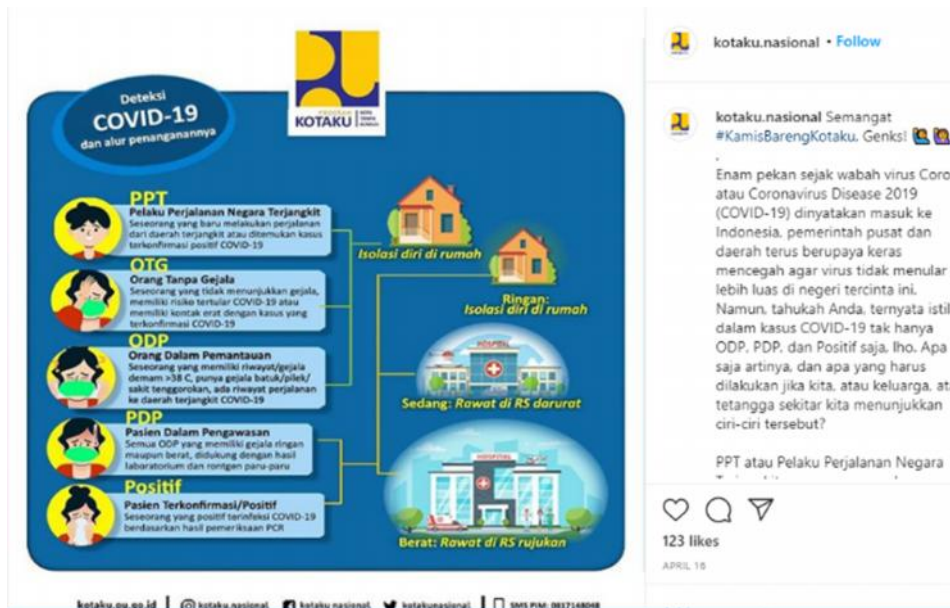
Gambar 8. Istilah ‘Orang Dalam Pemantauan (ODP)’ Digunakan dalam Postingan Instagram