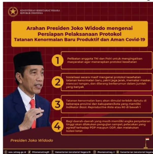
Gambar 21. Istilah ‘Kenormalan Baru’ Digunakan dalam Postingan Facebook

Yaitu istilah yang digunakan untuk menyebutkan keadaan yang baru atau keadaan yang belum pernah ada sebelumnya lalu menjadi kebiasaan. Istilah tersebut pernah digunakan dalam poster yang diposting dalam akun Facebook resmi Kementerian Sekretariat Negara Republik Indonesia pada 31 Mei 2020 (Kementerian Sekretariat Negara RI, 2020).