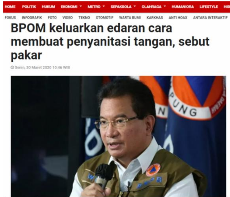
Gambar 16. Istilah ‘Penyanitasi tangan’ Digunakan dalam Judul Berita

Yaitu istilah yang digunakan untuk cairan yang umumnya terbuat dari alkohol dan triklosan untuk membersihkan tubuh dari kuman, khususnya bagian tangan. Istilah tersebut pernah digunakan dalam judul sebuah berita terbitan Antara News pada 30 Maret 2020 (Antaraneews, 2020).