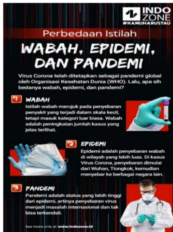
Gambar 4. Istilah ‘wabah’, ‘epidami’, dan ‘pandemi’ digunakan dalam poster.

Secara umum, ketiga istilah tersebut merujuk pada penyakit yang menular dan merebak di suatu wilayah dengan skala tertentu. Wabah merupakan kejadian terjangkitnya masyarakat oleh penyakit menular yang meluas secara cepat. Epidemi merupakan kejadian terjangkitnya masyarakat oleh penyakit menular yang meluas secara cepat di lebih satu area dengan tingkat penyebaran yang sulit untuk diprediksi. Pandemi merupakan kejadian terjangkitnya masyarakat oleh penyakit menular yang meluas secara cepat secara global. Adapun sejumlah penyakit menular juga pernah terjadi di Indonesia, mulai dari Cacar pada tahun 1644 hingga akhir abad ke-18, Malaria sejak tahun 1733 hingga tahun 1900-an, Flu Spanyol pada tahun 1918, Demam Berdarah Dengue (DBD) yang pertama kali teridentifikasi pada tahun 1968, hingga yang terbaru Flu Burung pada tahun 2003 dan Flu Babi pada tahun 2009 (Ayojakarta.com, 2020). Ketiga istilah tersebut pernah digunakan dalam poster oleh situs Indozone.id untuk mensosialisasikan kepada masyarakat mengenai perbedaan arti dari ketiga istilah tersebut (Indozone.id, 2020).