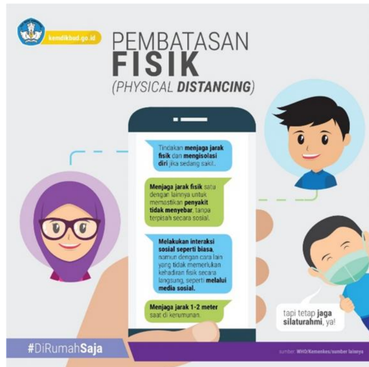
Gambar 15. Istilah ‘Pembatasan Fisik’ Digunakan dalam Postingan Twitter

Istilah ini hampir sama dengan istilah pembatasan sosial. Namun, pada tanggal 20 Maret 2020 Badan Kesehatan Dunia ( WHO ) mengganti istilah pembatasan sosial dengan pembatasan fisik guna menghindari kesalahpahaman yang kemungkinan terjadi di masyarakat. Istilah pembatasan fisik digunakan untuk mempertegas bahwa di masa pandemi ini hanyalah fisik yang berjauhan dengan tidak meninggalkan esensi bersosialisasinya. Istilah tersebut pernah digunakan dalam postingan akun Twitter @Kemdikbud_RI pada 31 Maret 2020 guna menjelaskan arti dari istilah tersebut.