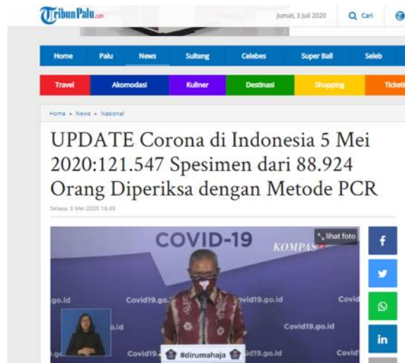
Gambar 5. Istilah ‘spesimen’ Digunakan dalam Judul Berita.