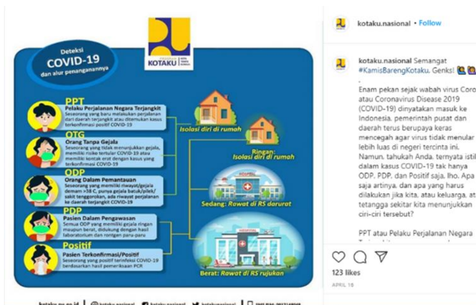
Gambar 9. Istilah ‘Orang Tanpa Gejala (OTG)’ Digunakan dalam Postingan Instagram

Yaitu istilah yang digunakan untuk orang yang tidak memiliki gejala apapun, tapi memiliki risiko tertular dari orang atau lingkungan yang terinfeksi penularan Virus Corona. Istilah tersebut pernah digunakan dalam postingan akun Instagram @kotaku.nasional pada 16 April 2020 guna menjelaskan arti dari istilah tersebut.