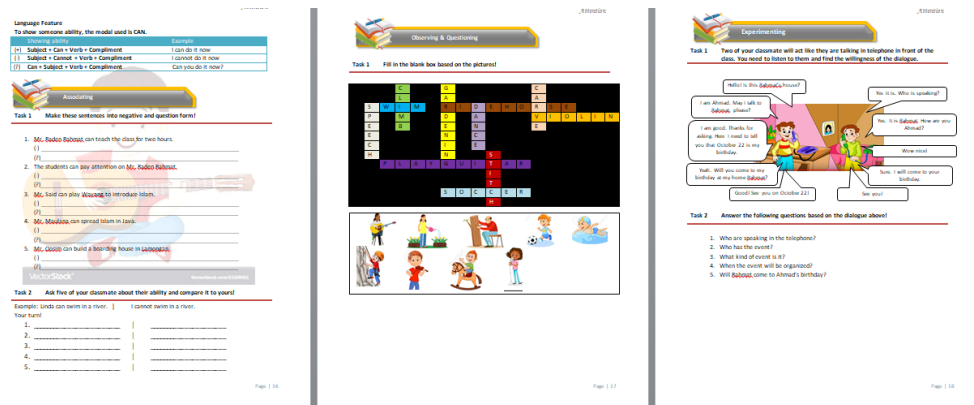
Gambar 4. Desain setelah dibuat lebihmenarik dan jelas

Hasil pre-test dan post test dapat dilihat pada Gambar 5.