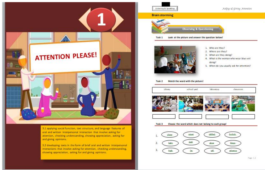
Gambar 1. Gambaran An Islamic English Work Book

Pada Gambar 1 terdapat judul pembahasan pada Chapter I (sebelah kiri) dan terdapat brain storming sebagai pemanasan awal sebelum masuk ke materi inti dalam proses belajar mengajar. Dari halaman awal LKS ini guru bisa mengajak siswa untuk aktif yang kemudian akan meningkatkan mood dalam belajar. LKS ini juga dirancang agar siswa tertarik untuk belajar. Dalam halaman ini siswa juga sudah mulai menerapkan penggabungan antara mendengar dan berbicara. Mendengar apa yang ditanyakan guru dan jawaban siswa lain, serta berbicara untuk menyampaikan pendapat mereka walaupun sangat singkat.