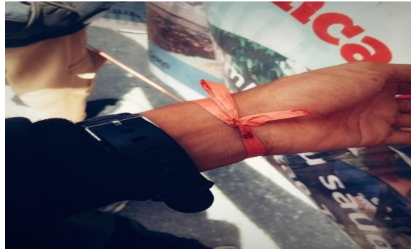
Gambar 15. Perjuangan yang Terus Mengalir dalam Nadi (Bumi)

Bumi memilih foto ini untuk menggambarkan pita di pergelangan tangan kiri sebagai tanda aksi massa, juga sebagai lambang bahwa perjuangan itu akan terus lahir selama nadi terus mengalir. Pita dalam foto tersebut dimaknai Bumi sebagai simbol keterikatan emosional dan komitmen terhadap perjuangan kolektif yang ia jalani bersama demonstran lain.