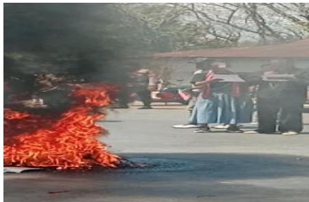
Gambar 8. Kontras Antara Api, Asap, dan Aspal (Batman)

Batman mengambil foto ini untuk menunjukkan amarah, lelah, dalam melawan ketidakadilan. Menurut Batman, emosi yang dilambungkan dengan kobaran api ini muncul sebagai respons terhadap pengalamannya menghadapi represi yang belum terjawab melalui tuntutan perjuangannya, sehingga memunculkan emosi negatif yang mendalam.