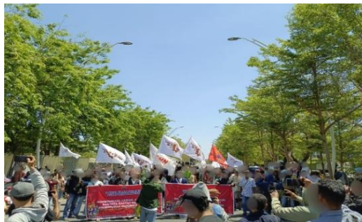
Gambar 18. Perjuangan Bersama (Pelangi)

Foto yang dipilih Pelangi merepresentasikan perjuangan bersama yang bersifat kolektif, di mana aksi demonstrasi melibatkan berbagai elemen gerakan rakyat dan mahasiswa. Makna ini menunjukkan bahwa pengalaman demonstrasi membentuk persepsi Pelangi tentang keadilan sebagai tanggung jawab moral yang melampaui ikatan sosial formal.