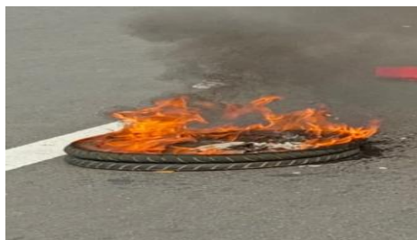
Gambar 7. Api (Fox)

Fox menggambarkan emosi yang dirasakannya secara berulang dengan gambar kobaran api. Kobaran api dimaknai Fox sebagai simbol emosi yang tidak padam, menggambarkan bagaimana ingatan akan kekerasan yang dialaminya terus menyala dan sulit dikendalikan, meskipun peristiwa tersebut telah berlalu.