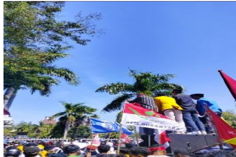
Gambar 6. Represi Baru Ala Aparat (Mars)

Mars menggambarkan pengalaman represinya yang memicu keresahan bagi demonstran, bahwa mereka sedang dikepung dan diawasi oleh orang-orang bersenjata lengkap selama mereka berusaha menyampaikan aspirasi. Melalui foto ini, Mars dapat merasakan kembali pengepungan pada masa demonstrasi saat itu yang memberikan perasaan tidak nyaman.