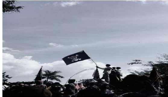
Gambar 12. In The Name of Liberation (Mars)

Mars memilih foto ini sebagai representasi bentuk kebebasan dalam memberantas ketidakadilan. Dalam foto itu terdapat bendera one piece yang dipersepsikan olehnya sebagai bendera kebebasan, khususnya kebebasan dalam bersuara memperjuangkan hak-hak manusia.