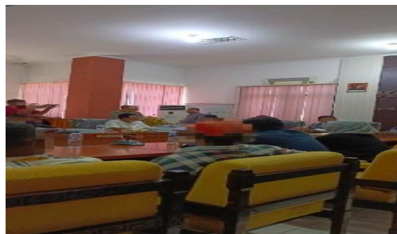
Gambar 16. Keberanian untuk Berbicara dan Menyuarakan Kebenaran (Batman)

Foto yang dipilih Batman merepresentasikan keberanian untuk berbicara dan menyuarakan kebenaran, yang baginya menjadi inti dari praktik demonstrasi. Demonstrasi dimaknai bukan hanya sebagai aktivitas fisik turun ke jalan, tetapi sebagai tindakan psikologis yang menuntut keberanian moral untuk melawan ketidakadilan, sekaligus menumbuhkan harapan akan perubahan, meskipun perubahan tersebut dirasakan kecil dan tidak selalu segera terwujud.