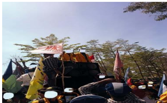
Gambar 2. Dibalik Suara, Ada Luka yang Tidak Pernah Ditampilkan (Aurora)

Aurora memilih foto ini karena menggambarkan rasa takut yang dialami saat menghadapi represi yang terjadi dalam demonstrasi. Menurut Aurora, foto tersebut merepresentasikan pengalamannya saat ia mendapatkan ejekan setelah ia memberikan orasi, hal ini memberikan rasa ketidaknyamanan.