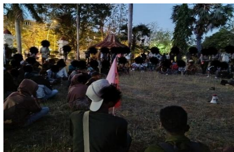
Gambar 11. Wajah Lain Demonstran (Pelangi)

Pelangi mengambil foto ini sebagai representasi konsolidasi dan titik temu kesadaran kolektif. Alasan Pelangi memilih foto perjuangan demonstran lainnya sebagai representasi strategi emosi koping