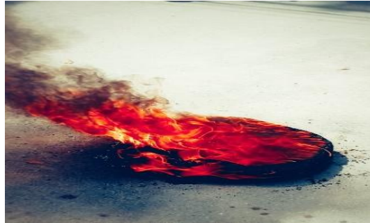
Gambar 17. Perasaan yang Membara (Bumi)

Bumi memilih foto benda yang terbakar untuk menggambarkan semangat kecil yang akan terus tumbuh menjadi besar. Pelangi juga mengatakan bahwa dirinya melihat masyarakat dan orang-orang yang ada di sekitarnya sebagai orang terdekatnya yang ketika ada dalam keadaan susah harus dibantu meskipun tidak memiliki hubungan yang kuat.