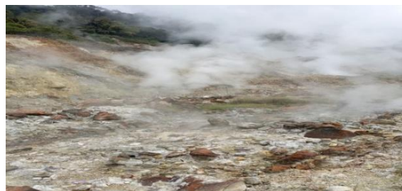
Gambar 14. Kerusakan Lingkungan

Fox menggambarkan makna keadilan sebagai keberpihakan nyata kepada kelompok masyarakat yang berada dalam posisi rentan dan tertindas. Foto kerusakan lingkungan yang dipilih Fox merepresentasikan dampak konkret dari ketidakadilan struktural yang dialami masyarakat, khususnya mereka yang kehilangan ruang hidup dan hak atas lingkungan akibat eksploitasi. Sedangkan keadilan bagi Bumi merupakan hak wajib yang harus didapat oleh seluruh masyarakat.