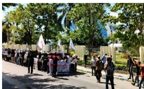
Gambar 3. Terik Matahari yang Membakar (Batman)

Aurora memilih foto ini karena menggambarkan rasa takut yang dialami saat menghadapi represi yang terjadi dalam demonstrasi. Menurut Aurora, foto tersebut merepresentasikan pengalamannya saat ia mendapatkan ejekan setelah ia memberikan orasi, hal ini memberikan rasa ketidaknyamanan.