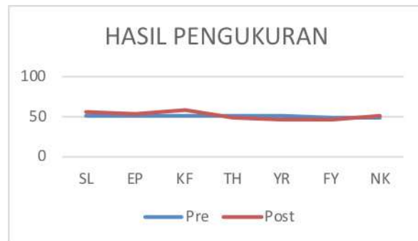
Grafik 2. Perbandingan Skor Pretest dan Posttest pada KK

Berdasarkan Tabel 9 dapat dilihat bahwa terdapat tiga subjek yang mengalami penurunan skor kualitas parenting namun dalam kategori yang sama yaitu rendah. Sedangkan empat subjek dalam skor dan kategori kualitas parenting yang menetap. Tidak adanya perubahan kualitas parenting subjek mulai dari pretest sampai posttest dapat juga dilihat dari hasil gain skor. Hasil gain skor tersebut digunakan untuk mengetahui skor kualitas parenting yang terjadi pada masing-masing subjek dengan menghitung selisih antara hasil posttest dan pretest . Adapun gain skor skala kualitas parenting pada KK dapat dilihat pada Tabel 9. Berdasarkan Tabel 9 dapat dilihat bahwa rata-rata gain skor pretest dan posttest pada KK = --1,43. Hal ini menunjukkan bahwa tidak terjadi peningkatan kualitas parenting KK pada posttest . Berikut ditampilkan Grafik 2 untuk melihat tidak adanya perubahan kualitas parenting pada masing-masing subjek KK.